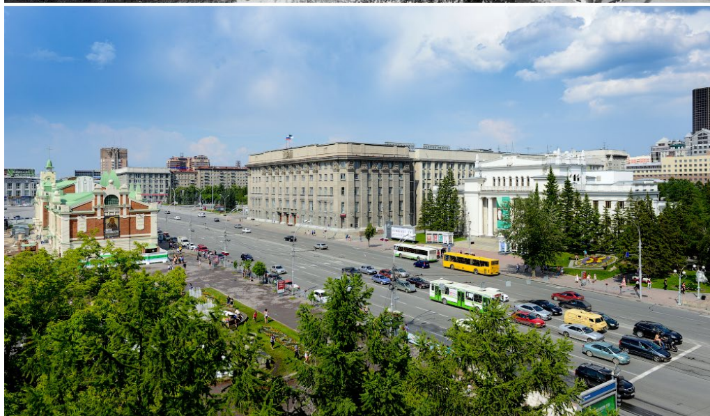
Ил. 1. Здание Промбанка, конец 1920-х и начало 2000-х гг. ( https://gelio.livejournal.com/206750.html )