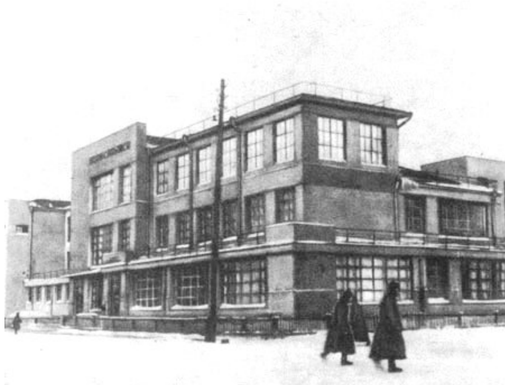
Ил. 3. Здание 1-й поликлиники в Новосибирске. Автор проекта П.А. Щекин ( http://nsk.novosibdom.ru/node/2299 )