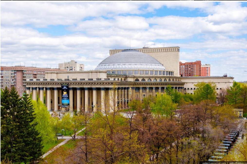
Ил. 6. Здание Дома науки и культуры (Новосибирский театр оперы и балета), 1930-е и начало 2000-х гг. ( https://gelio.livejournal.com/206750.html )