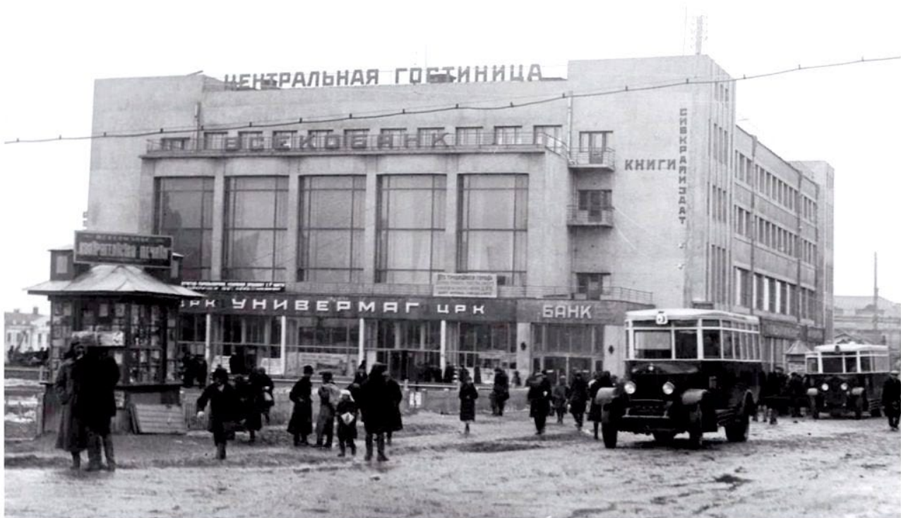
Ил. 2. Доходный дом в Новосибирске, конец 1920-х — начало 1930-х гг.

Другим идеологически важным архитектурным знаком Новобазарной площади явилась Никольская часовня, возведенная по проекту того же автора к 300-летию правящего дома Романовых. Учитывая характер революционной идеологии, в конкурсных проектах советской застройки