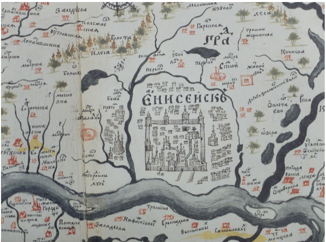
Ил. 2. Чертеж земли Енисейского города (фрагмент) [Дергачева-Скоп, Алексеев, 2006] Fig. 2. Drawing of the land of the Yeniseisk town (fragment) [Dergacheva-Osprey, Alekseev, 2006]

Оба изображения Енисейского острога нанесены на чертежи С.У. Ремезова в соответствии с существовавшей на Руси в допетровское время картографической традицией, т.е. без математической основы, строгого масштаба и с произвольным ориентированием относительно сторон света [Гольденберг, 1990, с. 18]. Поэтому стороны света на его чертежах имеют непривычную для нас направленность. На листе «Чертежа