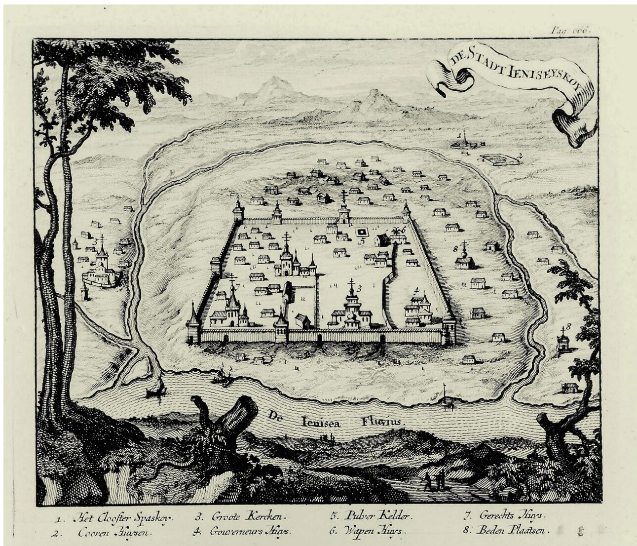
Ил. 3. Город Енисейск [Витсен, 1692] Фг. 3. The town of Yeniseisk [Witsen, 1692]

Какого года постройки Енисейский острог изображен у Н. Витсена и С.У. Ремезова. Теперь попробуем разобраться, какого времени постройки Енисейский острог был изображен на рисунках Витсена и Ремезова. Документальные источники свидетельствуют, что острог в течение XVII столетия регулярно перестраивался и восстанавливался по причине естественного ветшания стен и периодически возникавших пожаров и наводнений. В вышеприведенной отписке воеводы Ф.П. Полибина Енисейский острог описывается как очень вет-