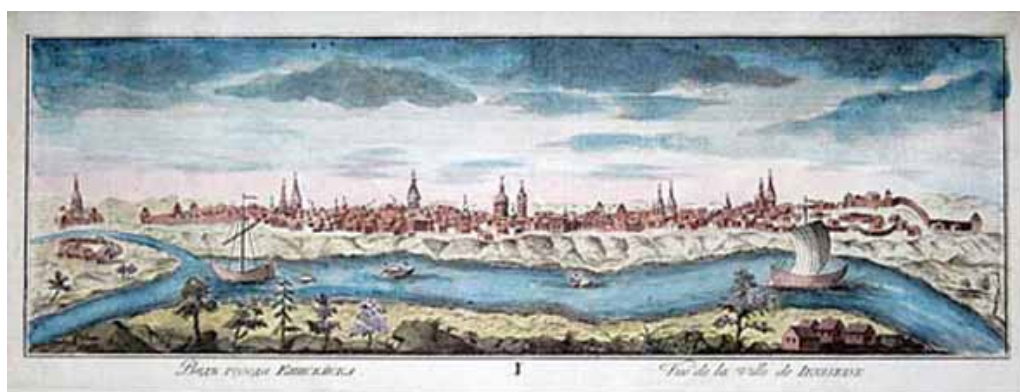
Ил. 5. Вид города Енисейска. Рисунок И.-В. Люрсениуса 1735 г. ( http://irkipedia.ru/node/11925/geografiya_novostey/geografiya_novostey/geografiya_novostey/geografiya_novostey/geografiya_novostey/all-dates )