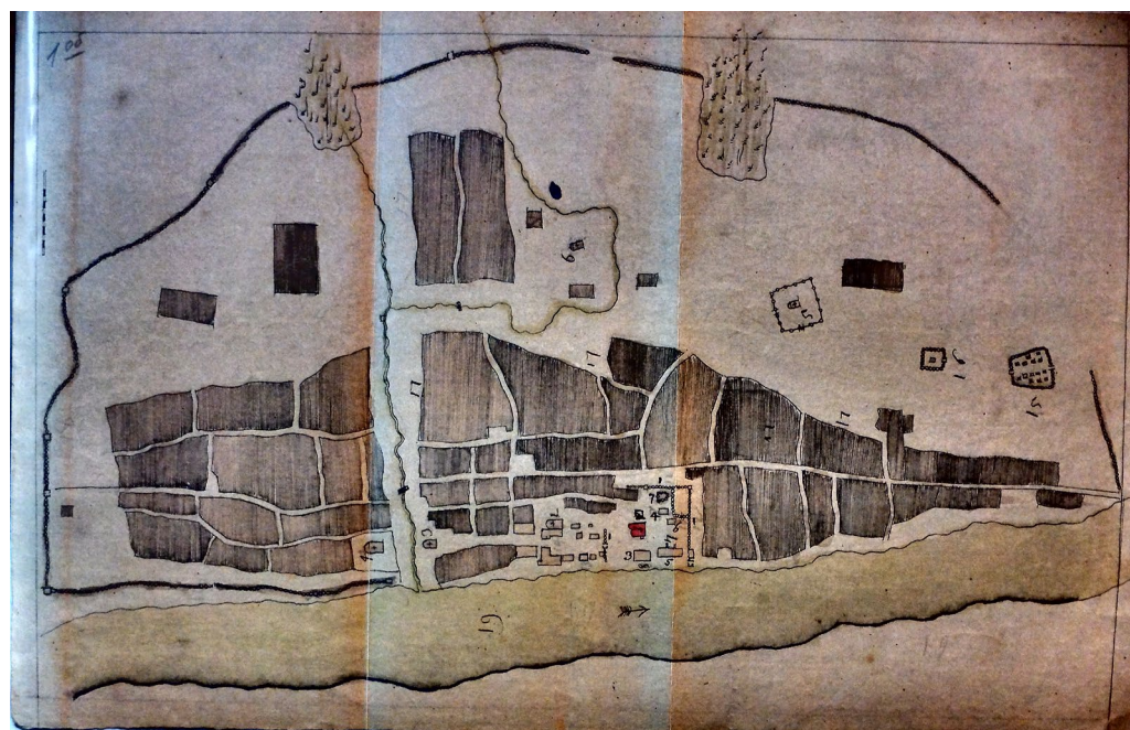
Ил. 4. План города Енисейска. 1735 г. Автор неизвестен [СПбф АРАН, Ф. 21. Оп. 5. Д.39/17. Л. 1–1 об.]

План и вид Енисейска 1735 г. В последующие годы острожные укрепления Енисейска ветшали естественным образом и сильно страдали от пожаров (1677 и 1703 гг.), но регулярно восстанавливались.