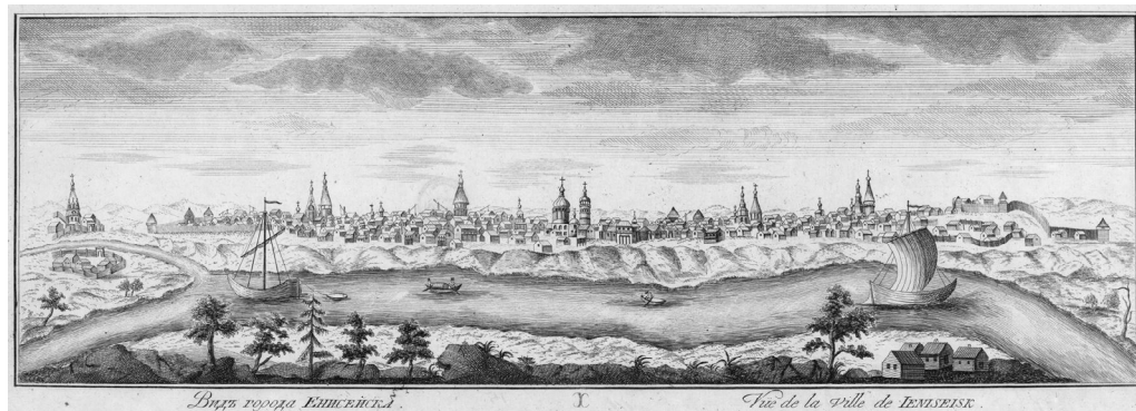
Ил. 6. Вид города Енисейска. Гравюра 1770 г. с рисунка И.-В. Люрсениуса ( https://radiovera.ru/aleksandr-balandin.html?autoplay=on )