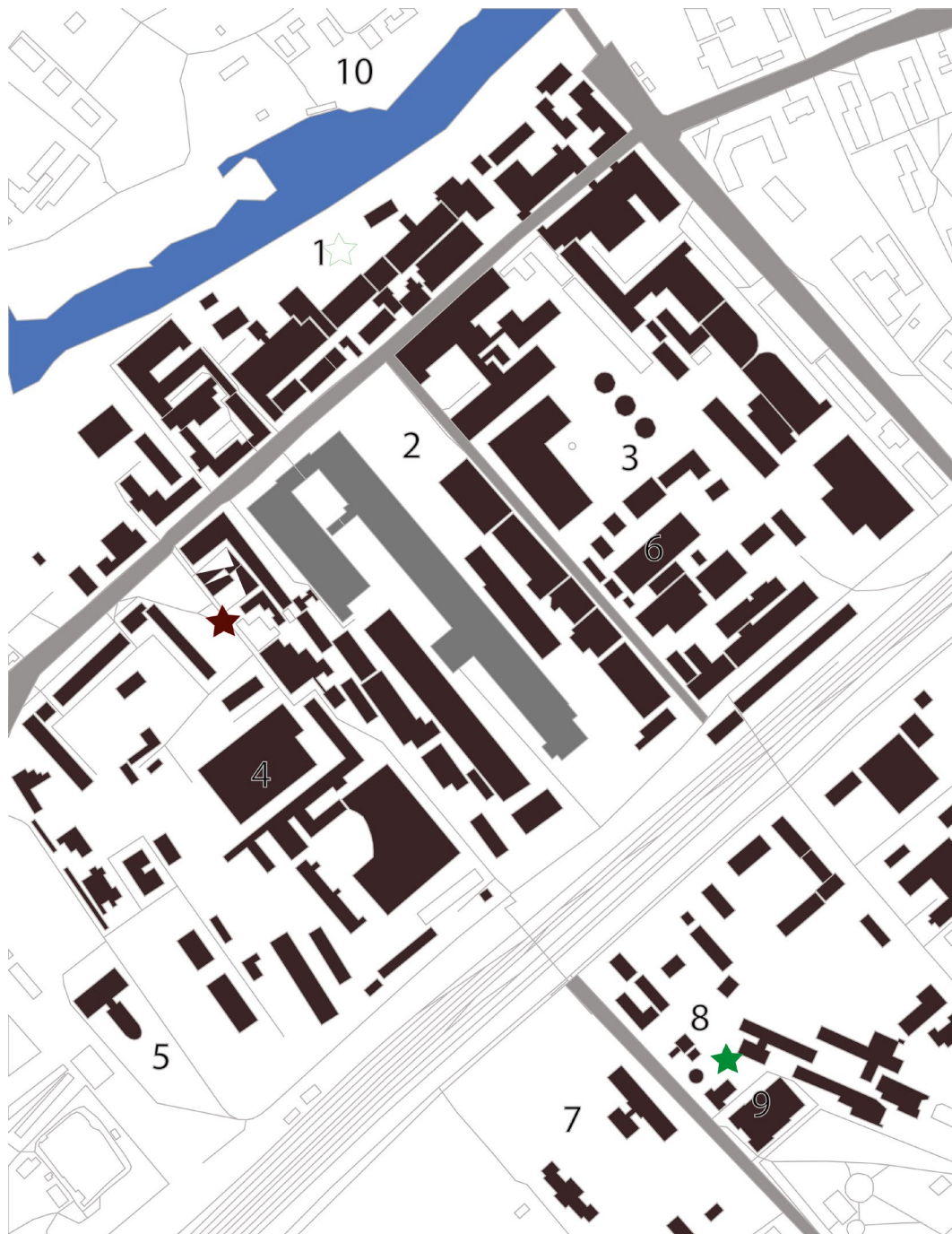
Ил. 2. Фрагмент плана г. Орехово-Зуево. Участок, ограниченный р. Клязьмой и ул. Ленина: 1 — Никольская мануфактура Морозовых 1840-х гг. (территория кластера креативных индустрий, создаваемого в рамках программы «Территории роста»); 2 — отбельно-красильный комбинат, 1978–1979 гг.; 3 — Ореховский текстильный комбинат; 4 — бывшая ткацкая фабрика № 2; 5 — Никольское начальное училище и Никольский храм 1864–1908 гг., ОКН РЗ; 6 — Орехово-Зуевская ТЭЦ, 1926–1930 гг., архитектор Я.А. Корнфельд; 7 — казарма 1908 г., ОКН РЗ; 8 — Морозовская водонапорная башня 1896 г., ОКН РЗ; 9 — КДЦ «Зимний театр», 1909–1912 гг., ОКН РЗ; 10 — действующие промышленные предприятия (схема выполнена авторами статьи)