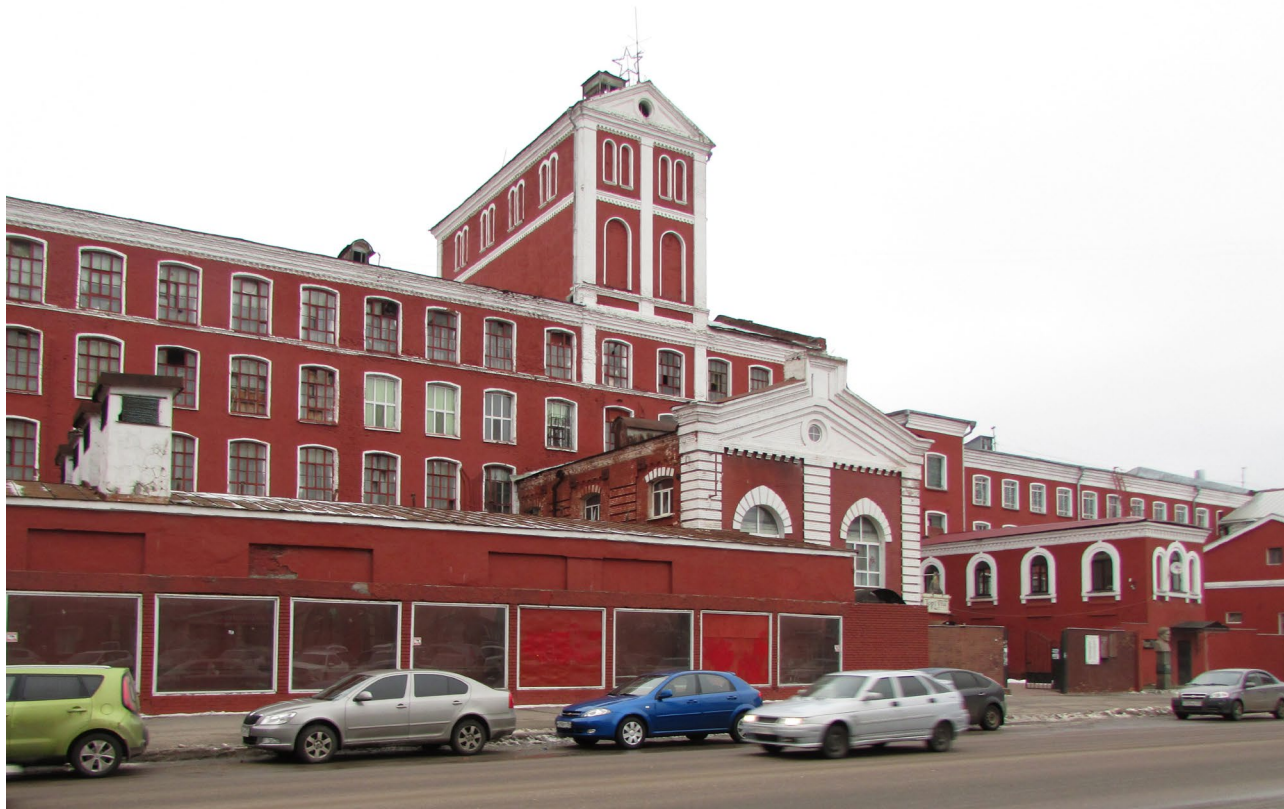
Ил. 3. Бывшая Первая бумагопрядильная фабрика Никольской мануфактуры Морозовых, 1847 г.

Стилеобразующими объектами и важными для сохранения с исторической, архитектурной и художественной позиций являются Зимний театр, больничный комплекс, водонапорная башня, казармы, церковь Ксении Петербургской. Следует заметить, что ареал расположения объектов создает благоприятную возможность для развития культурного кластера с использованием зданий, утративших свою первоначальную функцию (водонапорная башня и казарма для рабочих). В пешей доступности находятся здания ГГТУ и Классический колледж художественно-эсте-