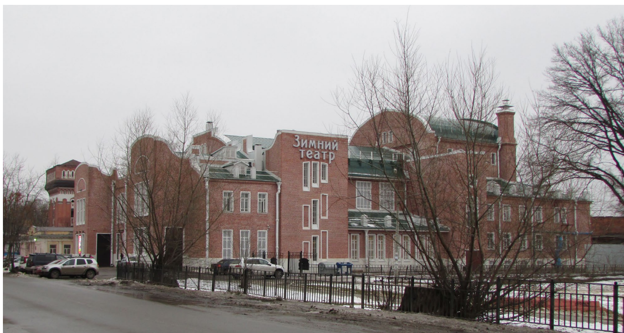
Ил. 6. Зимний театр в стиле модерн (1904–1912 гг., ОКН РЗ, архитектор А.А. Галецкий) Fg. 6. Zimniy Teatr (theater) of Art Nouveau (1904–1912, the cultural heritage site, architect A. A. Galetsky)