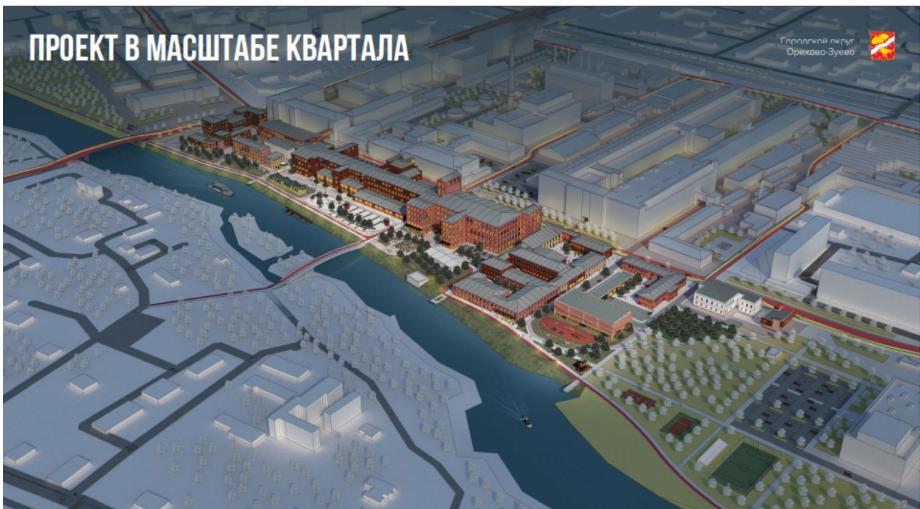
Ил. 4. Проект реновации территории Никольской мануфактуры. Решение в масштабе квартала ( https://invest.mosreg.ru/upload/media/default/0001/01/fa89c02ed35e31d8999fcca0a202cd9e58b19a57.pdf )

Водонапорная башня , построенная в 1896 г. в стиле модерн с элементами неоготики, представляла собой сооружение, напоминающее донжон средневекового замка и дополненное надстройкой с часами, утра-