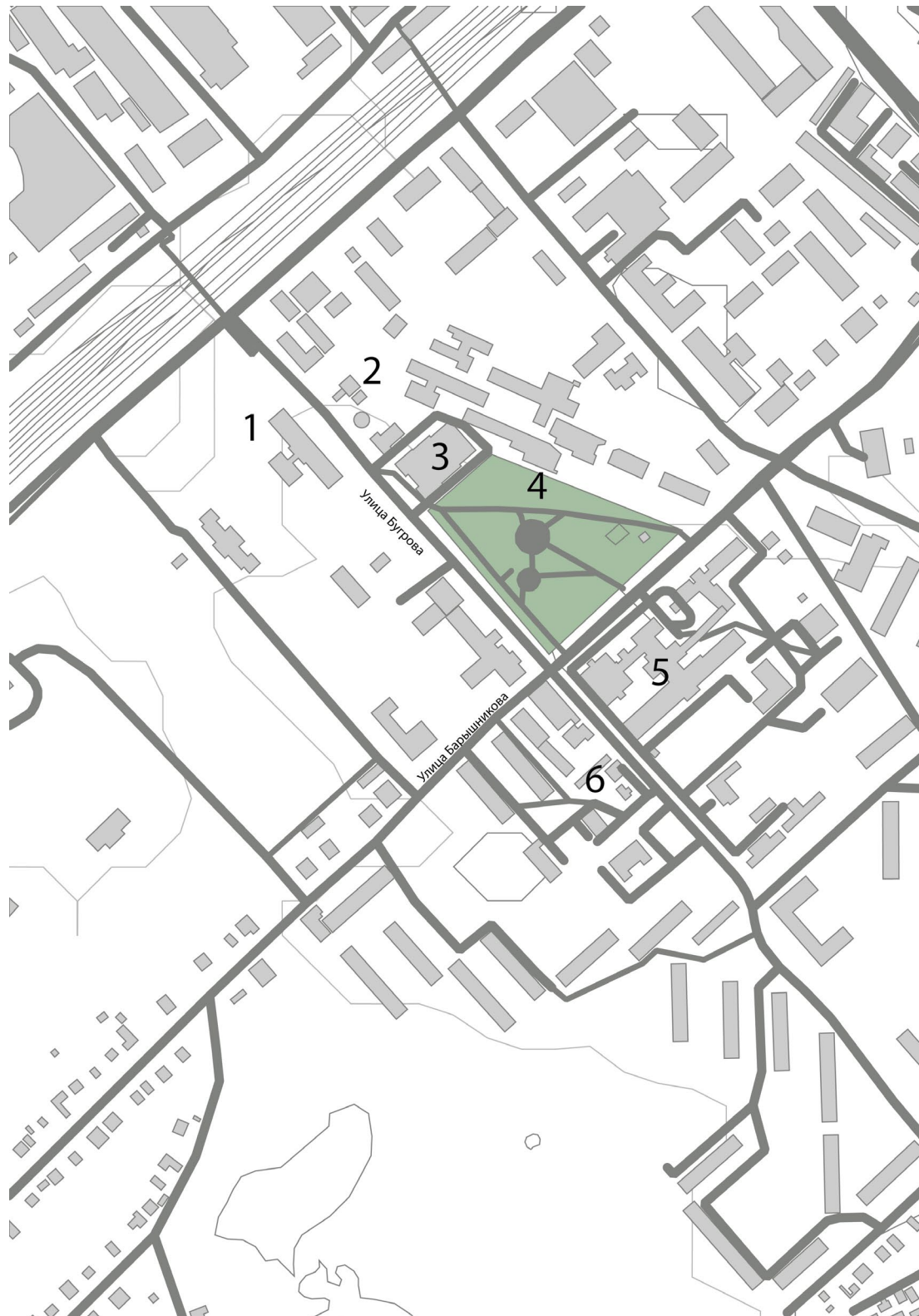
Ил. 5. Фрагмент плана г. Орехово-Зуево. Ареал расположения стилеобразующих объектов вдоль ул. Бугрова: 1 — казарма, 1908 г., ОКН РЗ; 2 — Морозовская водонапорная башня, 1896 г., ОКН РЗ; 3 — КДЦ «Зимний театр», 1904–1912 гг., ОКН РЗ; 4 — сквер Барышникова; 5 — Морозовская больница, 1906 г., выявленный ОКН РЗ; 6 — часовня Ксении Петербургской, 1903 г., ОКН РЗ (схема выполнена авторами статьи)