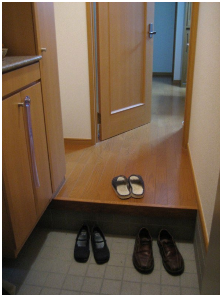
Илл. 1. Гэнкан. Входная зона в японской квартире

Одной из основных климатических проблем в Японии считается чрезмерная влажность, которая может достигать 100% в летнее время, вследствие чего создаются благоприятные условия для распространения различных грибков, инфекций и плесени. При возведении традиционных деревянных конструкций с плесенью боролись путем поднятия пола здания над уровнем земли. Стены оставляли открытыми, благодаря чему воздух мог свободно циркулировать под и над зданием, а также по всему помещению [Кохц, 2016, с. 1]. Устранялись излишние предметы обихода, также вся мебель и даже стены делались мобильными, что и привило японцам вынужденную любовь к минимализму. В современной архитектуре Японии минимализм проявлен не только в интерьере помещений, но и во внешнем облике зданий и выполняет по большей части эстетическую роль. Наряду с повышенной влажностью у японских архитекторов всегда возникали сложности из-за частых землетрясений и мощных тайфунов. Эту проблему в древности решали возведением легких каркасных конструкций из дерева без несущих стен. Крыша, напротив, сооружалась массивной, с длинными