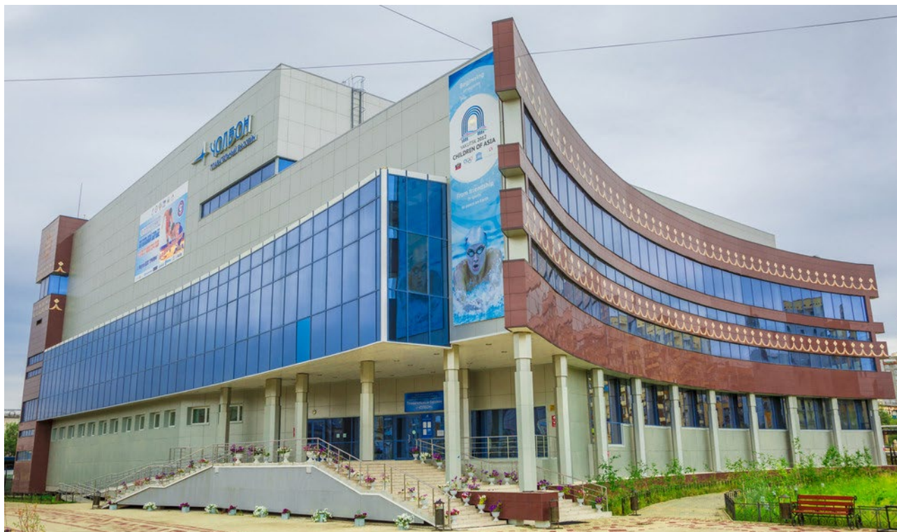
Ил. 5. Плавательный бассейн «Чолбон» ( https://news.ykt.ru/mobile/article/23496 ) Fg. 5. Cholbon, a swimming pool ( https://news.ykt.ru/mobile/article/23496 )

(кыстык). Однако с усвоением земледелия в XVII–XVIII вв. образ жизни стал оседлым.