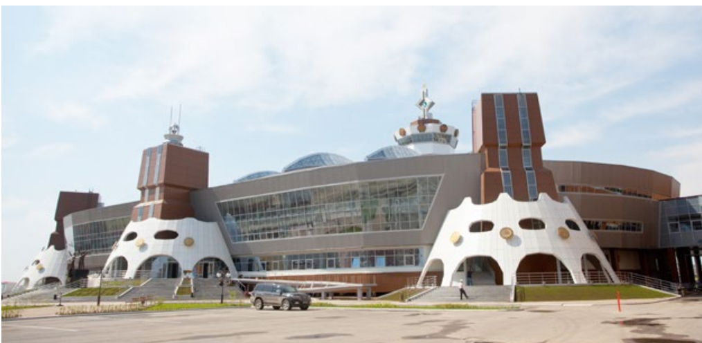
Ил. 4. Спортивный комплекс «Триумф»

Плотническое мастерство перешло на новый уровень: якутские зодчие с большим интересом перенимали технологии русского строительного искусства. Начали появляться срубные избы, православные церкви, острожки (ил. 3). Из-за резко-континентального климата раньше якутам приходилось вести полукочевой образ жизни, с наступлением лета перемещаясь в летники (сайылык), а со сменой сезона в зимники