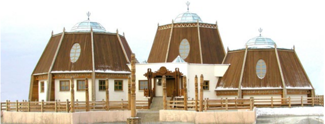
Ил. 6. Центр духовной культуры «Дом Арчы»

( https://dnevniky.ykt.ru/%D0%90%D0%B9%D1%8B%D0%BB5%D0%B0%D0%BD/489843 )