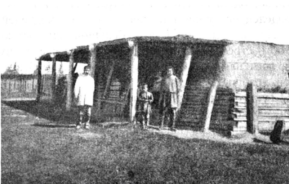
Ил. 2. Хотон [Пфиценмайер, 1928, с. 7]

При Реставрации Мэйдзи в 1868 г. в стране была запущена интенсивная европеизация, постепенно начал меняться подход к жизни. Благодаря выходу из длившейся долгие годы самоизоляции, в архитектур-