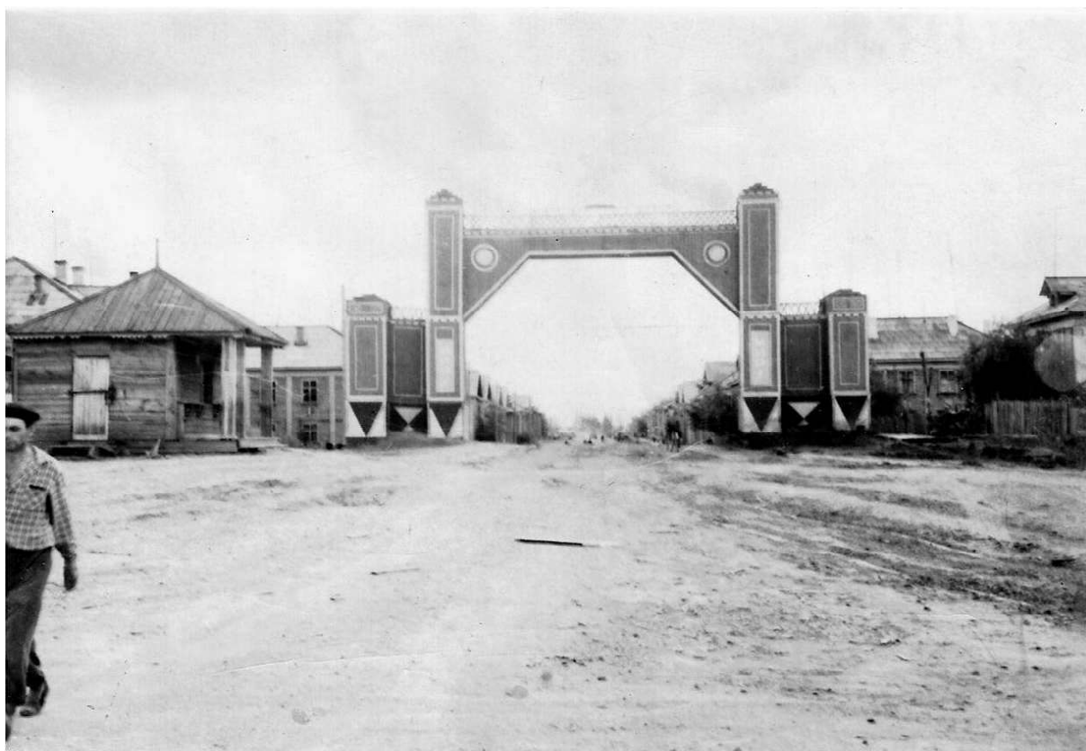
Ил. 5. Деревянная арка в п. Новомаклаково