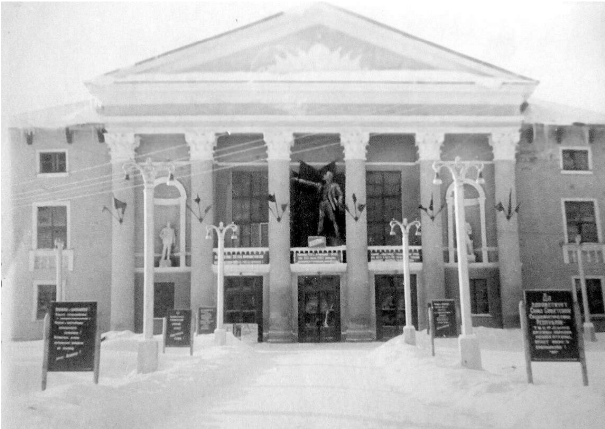
Ил. 3. Дом культуры Лесопильщиков (позже ЛДК Маклаковского) (URL: https://ok.ru/dorogieles/album/52669030858947/858032664259 )