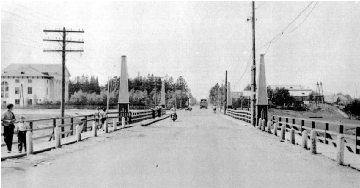
Ил. 4. Деревянный мост в п. Маклаково (URL: https://ok.ru/dorogieles/album/52669030858947/805675310531 )