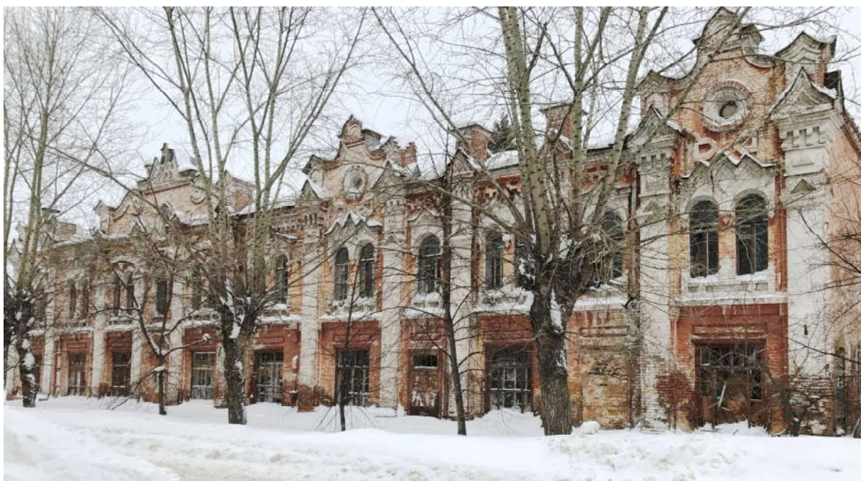
Ил. 3. «Пассаж Клевцова». Северо-западный фасад по ул. Л. Толстого. Современный вид.