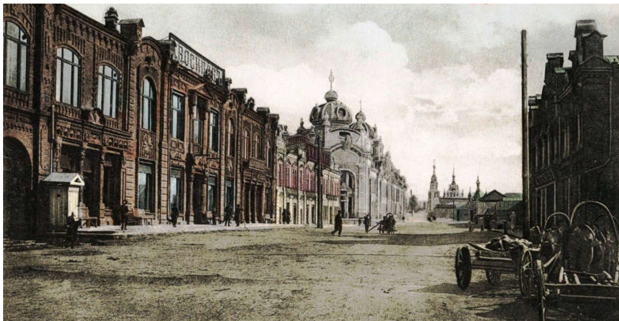
Ил. 1. Общий вид ул. Торговой (ул. Л. Толстого) в начале XX в., до перестройки здания в 1909 г.