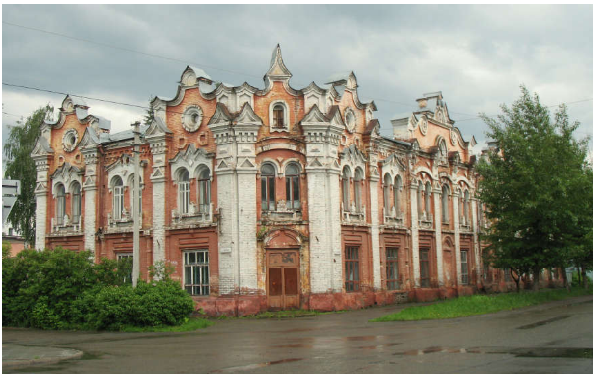
Ил. 2. «Пассаж Клевцова» по ул. Л. Толстого, 119. Современный вид с северо-востока.