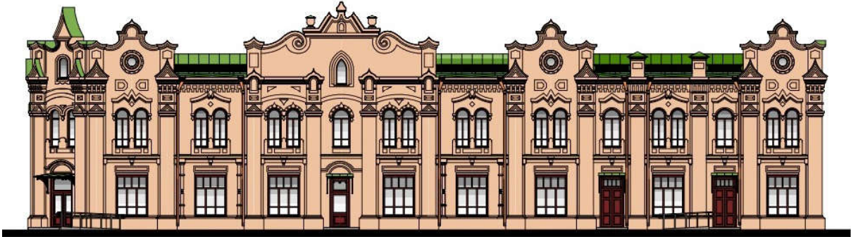
Ил. 4. Эскизный проект реставрации объекта культурного наследия «Пассаж Клевцова». ИП Тюкова Н.М., архитектор А.А. Машонкин. 2018 г.