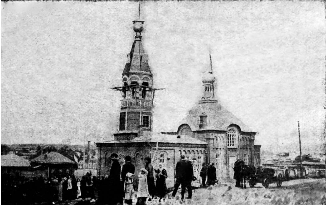
Ил. 2. Барнаул. 24 мая 1915 г. Крестовоздвиженская старообрядческая церковь. Поднятие крестов [Слово Церкви, 1915]