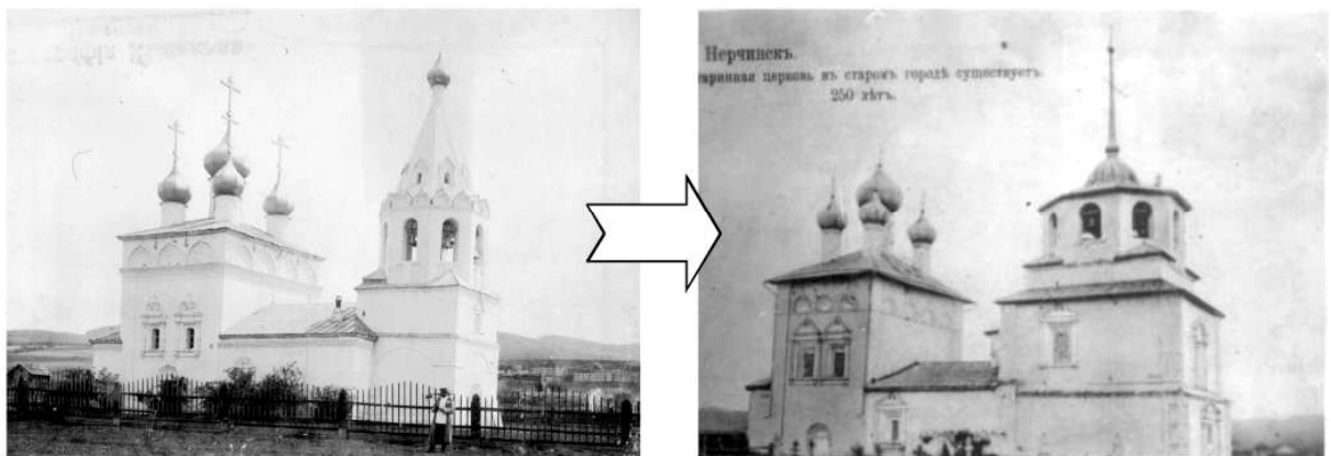
Ил. 2. Слева: Нерчинская Успенская церковь, построенная в 1708–1712 гг. Снимок Ф.Д. Соседко, начало XX в. ГАЗК, [ГАЗК. Ф. Р-2676. Оп. 1. Д. 8. Л. 1]. Справа: Церковь во имя Святой Живоначальной Троицы в Нерчинске, построенная в 1712–1720 гг. Снимок конца XIX в. ГАЗК, [ГАЗК. Ф. Р-2676. Оп. 1. Д. 8. Л. 3]